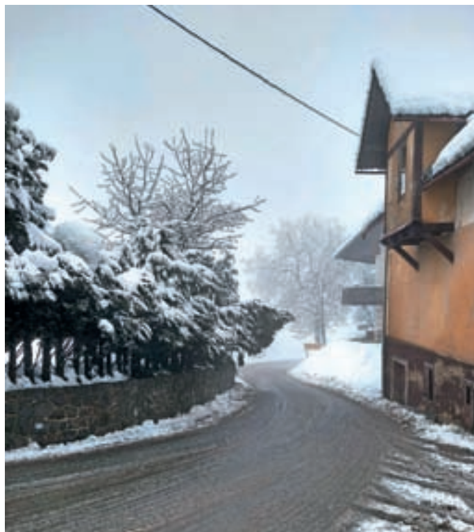
Primer žive meje nad voziščem v zimskem času

Občinska uprava Občine Gorenja vas - Poljane posebej obvešča, da lahko lastniki novozgrajenih stanovanjskih objektov na občino vložijo vlogo za petletno oprostitve plačila nadomestila za uporabo stavbnega zemljišča (v nadaljevanju NUSZ). Petletna doba oprostitve plačevanja NUSZ začne teči z dnem prijave stalnega prebivališča, upošteva pa se od dneva vložitve popolne vloge. Plačila so na osnovi oddane vloge oproščeni tudi prejemniki socialnih pomoči Centra za socialno delo in lastniki objektov, ki so jih prizadele elementarne nesreče. Obrazec vloge za oprostitve je zavezancem na voljo na spletni strani občine v rubriki Obrazci in vloge/Nadomestilo za uporabo stavbnega zemljišča – NUSZ.