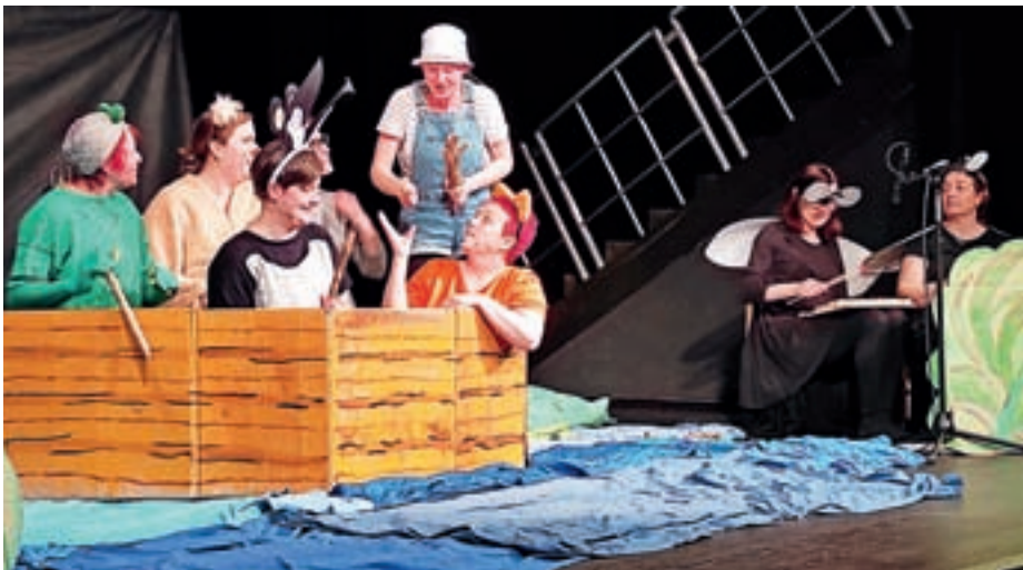
S predstave Bobek in barčica