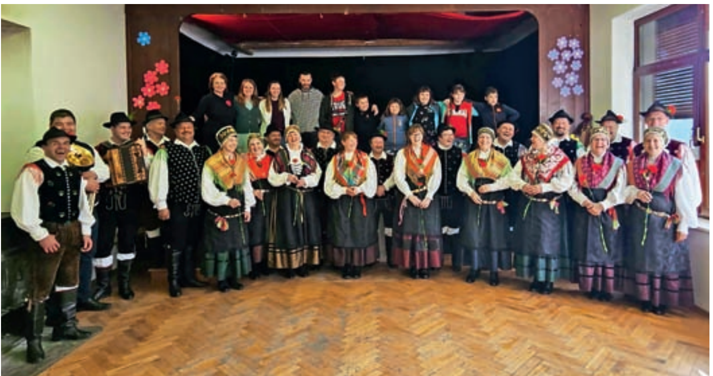
Kot gostje so na prireditvi ob materinskem dnevu v Leskovici nastopili člani folklorne skupine s Sovodnja.