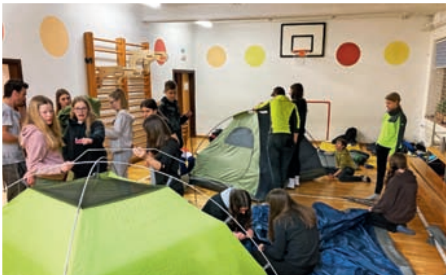
Mepijevci vadijo postavljanje šotorov.