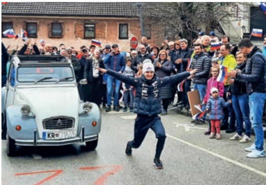
Emo Klinec je v Poljanah pričakala množica navijačev.

Poljanska dolina je ena tistih, ki tako rekoč dihajo za skoke. Kako tudi ne, saj od tu prihaja cvetober uspešnih skakalcev in v zadnjih letih predvsem skakalk. Čeprav je na dan sprejema dopoldne lilo kot iz škafo, celo zagrmelo je, so bili organizatorji sprejema Fan club Klinec optimistični. »Emo bo prinesla sonce,« so se nadejali. In res je bilo tako – ko je Emo prišla v Poljane, so se oblaki razkadili, posijalo je sonce, marsikatera solza sreče je spolzela po licih. Dežja ni bilo več, so pa deževale čestitke, Emo je podpisovala zastavice, tudi selfiji so nastajali, vsakdo ji je želel stisniti roko in ji čestitati za izjemne uspehe v letošnji sezoni. Na vprašanje, ali je že ponotranjila občutek rekorderke, je Emo v svoji skromni maniri odgovorila: »Ne še čisto, se ga pa vedno bolj zavedam; ste se pa zelo potrudili za današnji sprejem, Poljanci nikoli ne razočarate ...« Povedala je, da je bila turneja Raw Air zelo naporna: »Dekleta niti nismo imela veliko časa za razmišljanje, uradni trening v Vikersundu je potekal zelo hitro,