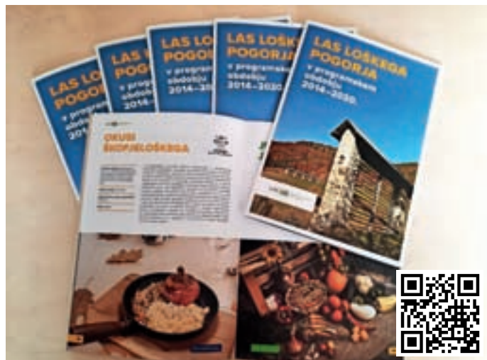
Po zadnjem programskem obdobju so v LAS loškega pogorja izdali publikacijo o zaključenih projektih.

Za pripravo nove strategije so v marcu v vsaki od občin Škofje-loškega organizirali animacijske delavnice, ki so potekale pod geslom Sooblikuj podeželje!, na katerih so sodelovali vsi zainteresirani deležniki območja. Objavili so tudi spletno anketo, s katero lahko prebivalci posredujejo svoje razvojne pobude, na spletni strani LAS pa je objavljen tudi obrazec, ki je namenjen tistim, ki imajo že bolj izdelane projektne ideje. Strategija za novo programsko obdobje naj bi bila potrjena predvidoma 13. decembra letos, zato predvidevajo, da bodo prvi javni poziv lahko speljali v začetku prihodnjega leta. LAS na javnih pozivih razpisuje sredstva na posamezne ukrepe, višina razpisanih sredstev pa se določi za vsak javni poziv posebej, enako tudi najvišja vrednost projekta. Število projektov je odvisno od interesa lokalnega okolja oziroma prijaviteljev. LAS na podlagi določenih kriterijev prejme sredstva iz sklada EKSRP in ESRR, ki jih med programskim obdobjem razpisuje na javnih pozivih. Sredstva niso določena na posamezno občino,