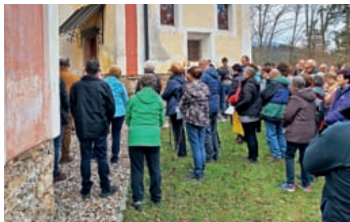
Na peto postno ali tiho nedeljo je bila pri cerkvi sv. Križa nad Srednjo vasjo molitev križevega pota.

Dne 5. marca je kot prvi izmed dogodkov Dnevov Škofjeloškega pasijona potekal križev pot od Poljan do cerkve sv. Jurija na Volči, 12. marca je potekal od cerkve sv. Volbenka na Logu do cerkve sv. Primoža in Felicijana na Gabrški gori, 19. marca iz Hleviš do cerkve Marijinega vnebovzvetja na Gori – Malenskem vrhu, 26. marca, na tiho nedeljo, okrog cerkve sv. Križa na Brezju nad Srednjo vasjo ter na cvetno nedeljo 2. aprila od mežnarja do cerkve Žalostne Matere Božje na Bukovem vrhu. Pri križevih potih so sodelovali domačini, pridružili pa so se jim tudi obiskovalci od drugod. Za zaključek so na veliki petek, 7. aprila, pripravili še križev pot pri župnijski cerkvi v Poljanah.