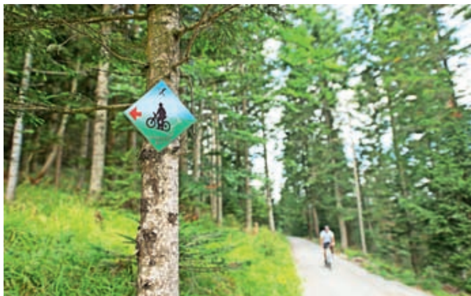
V maju bo na Visokem potekalo odprtje občinskega kolesarskega kroga.

V soboto, 6. maja, se bo na Dvorcu Visoko zvrstilo še odprtje občinskega kolesarskega kroga. Kolesarsko društvo Belaunce bo skupaj z Zavodom Poljanska dolina poskrbelo za bogat spremljevalni program. V jutranjih urah bosta potekala uvodni pozdrav župana Občine Gorenja vas - Poljane