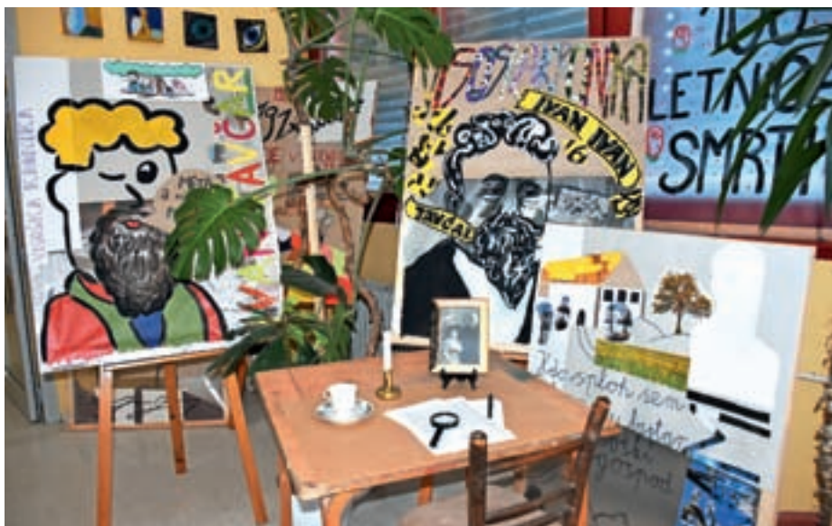
Tavčarjev kavni kotiček