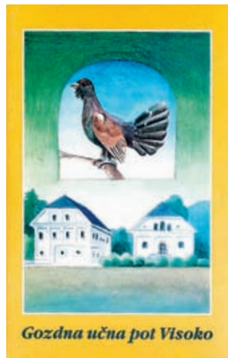
Za simbol Gozdne učne poti Visoko so izbrali divjega petelina.